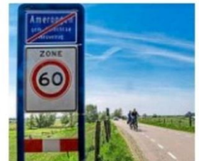
De Lekdijk bij Amerongen.

Daarnaast willen de partijen BHV Lokaal, Open, D66 en Christen-Unie, samen goed voor 16 van de 29 zetels in de raad, dat de gemeente in overleg gaat met de gemeente Wijk bij Duurstede om nog voor de zomer 2023 een pilot te starten voor de tijdelijk afsluiting voor motoren. Indien blijkt dat dit overleg met deze buur-