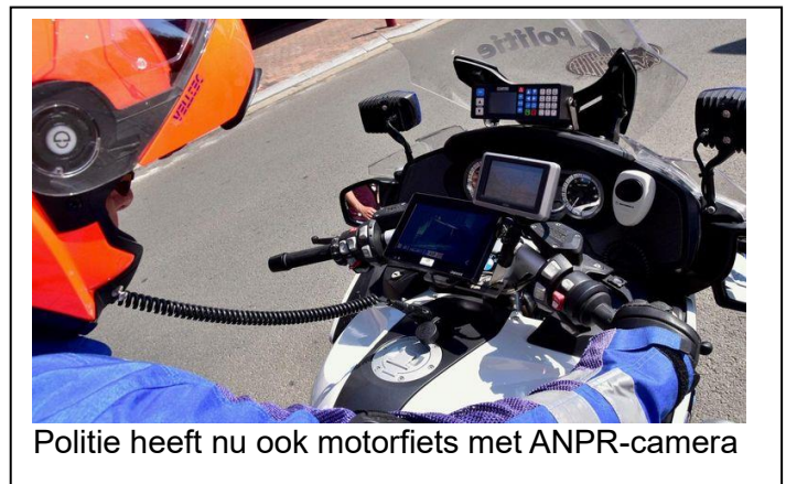
Politie heeft nu ook motorfiets met ANPR-camera

De camera's maken opnamen van kentekens. Die worden door speciale software gelezen en vergeleken met nummerborden in de database van de politie. Die beschikt over lijsten met kentekens van voertuigen die door de politie om een of andere reden worden gezocht. Het gaat bijvoorbeeld om auto-eigenaren die nog een gevangenisstraf open hebben staan of nog een hoge boete moeten betalen. Ook gestolen auto's staan in de database.